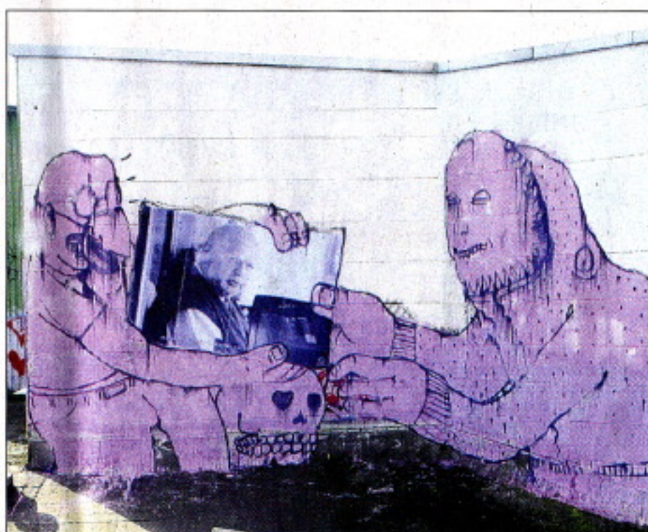
Diese Kunst widerspricht sich selbst: „Zeus“ schrieb „Graffiti Clean City“ an der Uellendahler Straße; JR sprühte entlang der Schwebebahn.