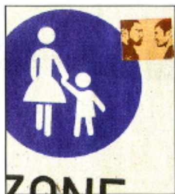
Kunst im Kleinformat: Tafeln an der Laurentiusstraße und auf einem Straßenschild an der Auer Schulstraße.